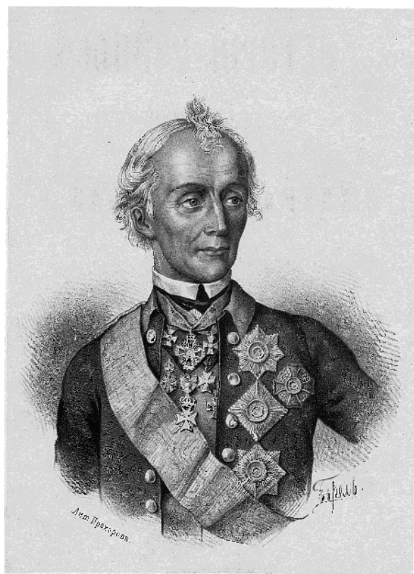
СУВОРОВЪ АЛЕКСАНДРЪ ВАСИЛЬЕВИЧЪ 1730 — 1800