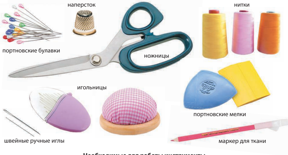
Необходимые для работы инструменты

упругим, что может привести к его распусканию, поэтому особенно тщательно нужно закреплять концы каждого такого шва. Недостатком синтетической нити является то, что она может расплавиться при высокой температуре и тем самым деформировать шов.