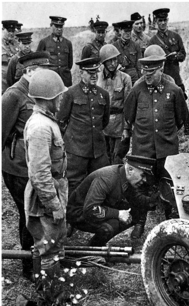
С.К. Тимошенко осматривает 45-мм противотанковую пушку на предвоенных учениях. Стоят Г.К. Жуков и К.Е. Ворошилов.