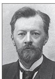
Шухов Владимир Григорьевич

* 5. Используя справочную литературу и Интернет, раскрой вклад этих людей в российскую культуру.