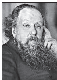
Циолковский Константин Эдуардович