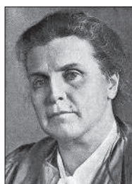
Мухина Вера Игнатьевна