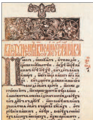
В) Первые печатные книги на Руси.