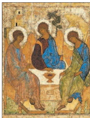
Г) Икона «Троица».