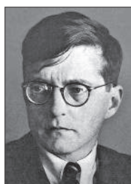
Шостакович Дмитрий Дмитриевич