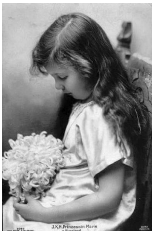
Мария Кирилловна, княгиня Лейнингенская, урожденная Романова