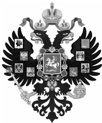
Герб Российской империи

Признаем: из продавца идей Запад давно превратился в покупателя. В связи с этим возникает законный вопрос: какой же привлекательный идеологический товар Россия может предложить Западу и миру? Может быть, то, чего им так сейчас отчаянно не хватает, — традиционные ценности, христианство, европейскую идентичность, легитимацию элит, консерватизм с человеческим лицом? По большому счету, тот же товар, который русские продавали с XVIII века, за исключением коммунистического исторического эпизода, — Империю.