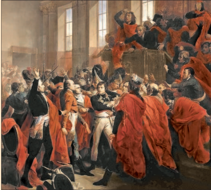
Ф. Буше. Переворот 18 брюмера

В Конституции говорилось: первый консул «назначает и отзывает согласно собственной воле членов государственного совета, министров, посланников и других ответственных внешних представителей, офицеров армии и флота, членов местной администрации, правительственных комиссаров при судах; он назначает уголовных и гражданских судей, равно как и судей мировых и кассационных, без права их отстранения от должности».