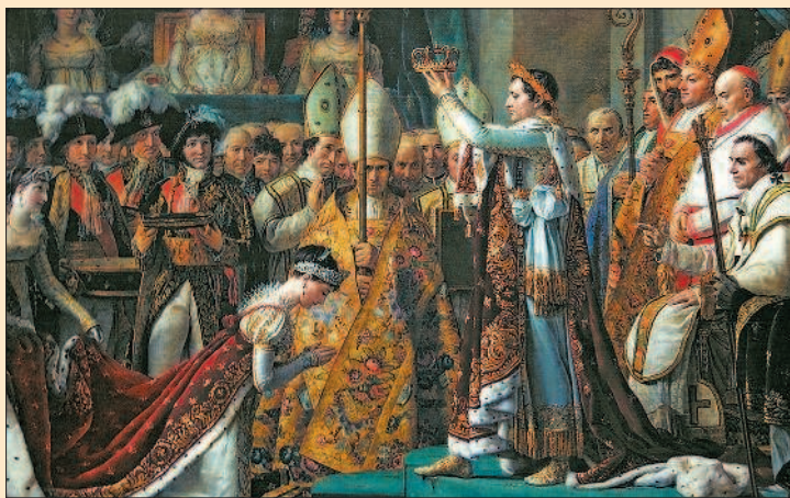
Ж.-Л. Давид. Коронация Наполеона и Жозефины

В первые годы правления императора Франция формально оставалась республикой. Сенатский закон от 28 флореаля XII г. (18 мая 1804 г.) провозглашал: «Управление республикой вверяется императору, который принимает титул императора французов». Монархический строй окончательно утвердился после принятия Наполеоном титула короля Италии в 1805 г. Но уже с первых шагов своего единоличного правления Наполеон окружил себя пышным двором. Во Франции вновь вводились дворянские титулы, обладатели которых составили «новое дворянство», полностью зависимое от своего повелителя. Внешние атрибуты императорской власти вытеснили республиканскую символику. Возрождая монархическое государство, бывший революционный генерал полагал, что это в большей степени соответствует политическим традициям Франции.