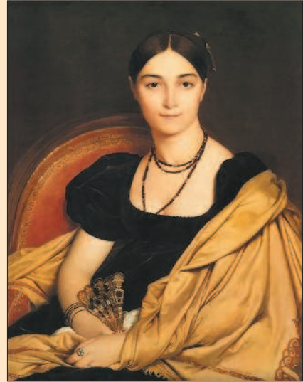
Ж.-О. Энгр. Портрет мадам Девосе

дожники запечатали на своих полотнах крупнейшие сражения наполеоновской эпохи, образ Наполеона и портреты других своих современников.