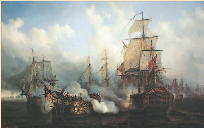
А. Майер. Трафальгарская битва

В августе 1805 г. Австрия объявила Франции войну, которая привела к полному перевороту в системе европейских государств. Не дожидаясь подхода русской армии, австрийские войска начали наступление в Баварии. Наполеон, заключив союз с Баварией, нанёс ответный удар, принудив австрийцев к капитуляции в баварской крепости Ульм. А на следующий день, 21 октября 1805 г., произошло знаменитое сражение у мыса Трафальгар в Средиземном