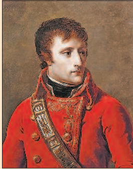
Бонапарт — первый консул

неполитические возможности для успешного внутреннего развития. Чтобы подчеркнуть наступление новой эпохи, Бонапарт сменил военный мундир на гражданский костюм из красного шёлка с чёрным галстуком. Символом перемен стал орден Почётного легиона, которым награждались за выдающиеся заслуги в деле укрепления величия Франции.