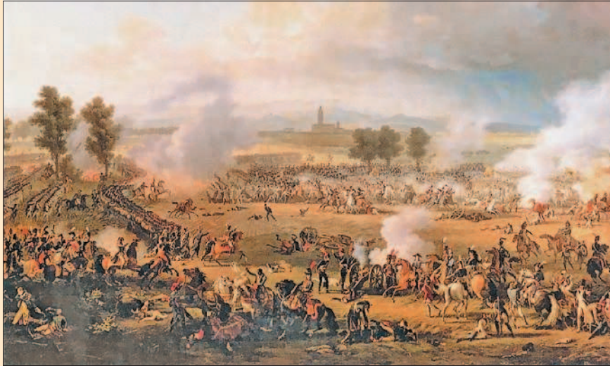
Л.-Ф. Лежён. Сражение при Маренго 14 июня 1800 г.

Тем временем разногласия между Англией и Россией привели к открытому разрыву отношений между недавними союзниками. Поводом для этого стал захват англичанами Мальты, покровителем которой считался российский император Павел I (сменивший его на троне Александр I вынужден был пойти на примирение с Англией). Пользуясь обострением англо-русских отношений, первый консул Франции в октябре 1801 г. добился мирного соглашения с Россией. Помимо этого две державы подписали секретную конвенцию, предусматривавшую совместные действия по преобразованию Германии и Италии.