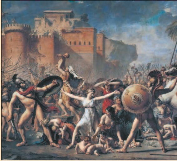
Ж.-Л. Давид. Сабинянки, останавливающие битву между римлянами и сабинянами