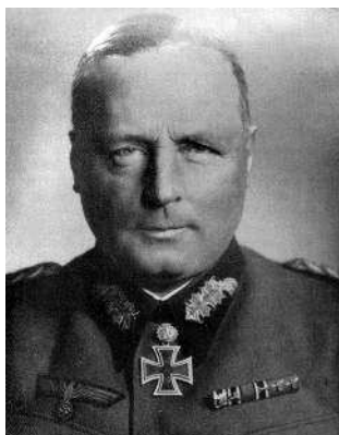
Командующий 1-й танковой армией генерал-полковник Ханс-Валентин Хубе.

пательные задачи получили 1-й, 2-й и 3-й Украинские фронты. Впоследствии эти наступления получили наименования Проскуровско-Черновицкой, Уманско-Ботошанской и Брезнеговато-Снегиревской операций. Тогда было трудно предполагать, что задуманные на период распутицы операции станут одними из самых крупных и результативных наступлений Красной армии в истории всей войны.