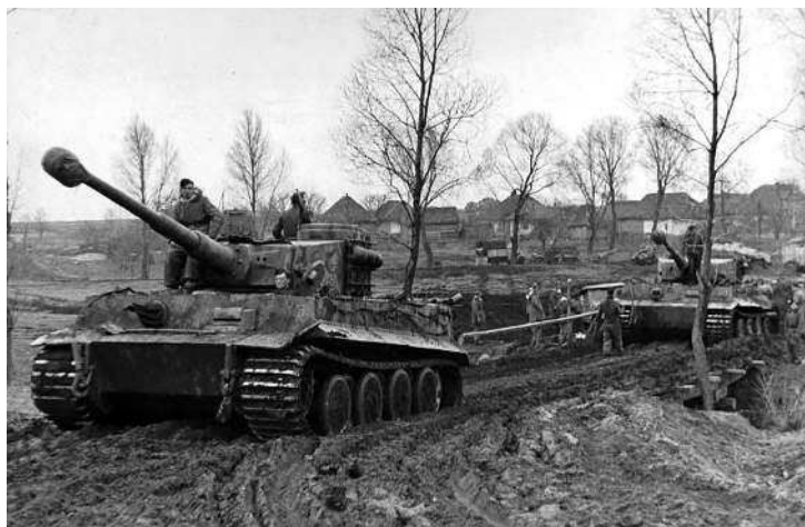
«Тигры» 1-й танковой дивизии СС «Лейбштандарт Адольф Гитлер» на марше.

пательные задачи получили 1-й, 2-й и 3-й Украинские фронты. Впоследствии эти наступления получили наименования Проскуровско-Черновицкой, Уманско-Ботошанской и Брезнеговато-Снегиревской операций. Тогда было трудно предполагать, что задуманные на период распутицы операции станут одними из самых крупных и результативных наступлений Красной армии в истории всей войны.