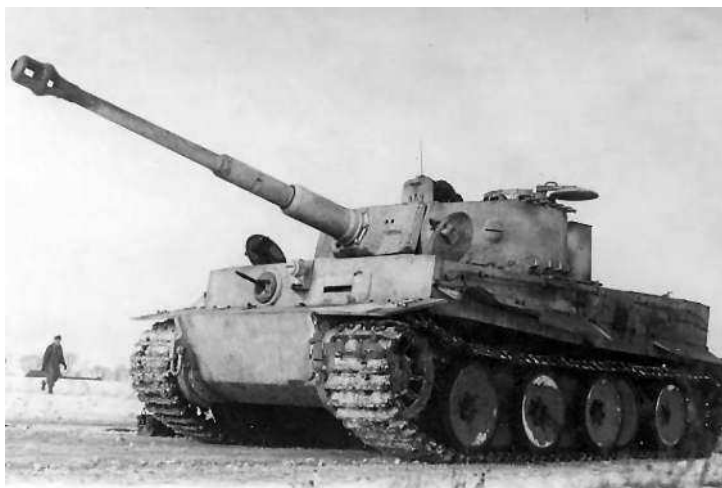
Немецкий тяжелый танк «Тигр». Машина с новой командирской башенкой с низким силуэтом.

Весеннее наступление. С началом таяния снега и превращения грунтовых дорог в казавшееся бездонным жидкое месиво боевые действия на советско-германском фронте обычно постепенно замирали. Наступала легендарная rasputitsa , и в дело вступал выдающийся полководец всех времен и народов General Schlamme 1 . В 1942 г. и 1943 г. середина весны становилась периодом затишья. Однако 1944 г. в этом отношении стал исключением. Советским командованием было запланировано продолжение успешной зимней кампании 1943/1944 г. Следует подчеркнуть, советское верховное командование задумало весеннее наступление на всем огромном пространстве от Полесья до Днепра в районе Николая в южном секторе советско-германского фронта. Насту-