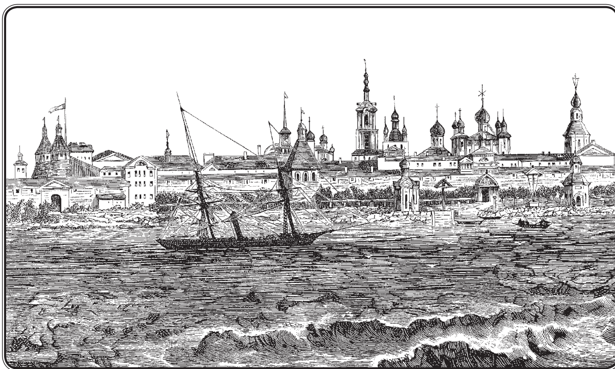
Вид Соловецкого монастыря с моря.

не можем. По чрезвычайной бодрости духа и тела он легко переносил всякие трудности; скука для него не существовала, и ум его работал непрерывно. Но было в этой жизни одно обстоятельство очень тяжело: это — беспрестанные и долгие разлуки с семейством, которое можно назвать нежно любимым не ради одного приличного и красивого выражения. В 1869 году, в сен-