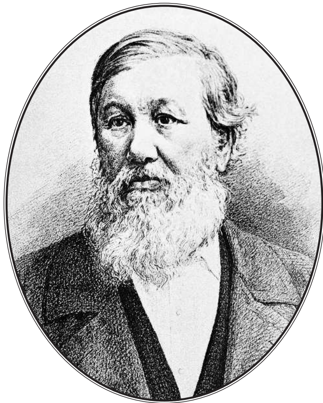
Николай Яковлевич ДАНИЛЕВСКИЙ (28.11.1822 — 7.11.1885)

Русский публицист, философ и естествоиспытатель, идеолог панславизма, глава «поздних славянофилов», «почвенников». Создатель теории культурно-исторических типов, предвосхитившей теории локальных цивилизаций О. Шпенглера и А. Тойнби.