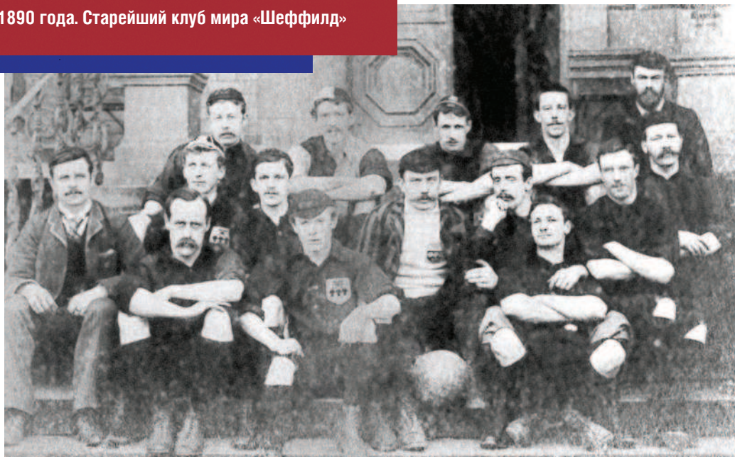
Снимок 1890 года. Старейший клуб мира «Шеффилд»

В 1857 году образован старейший футбольный клуб в мире «Шеффилд» из одноименного города в центре Англии, непода-