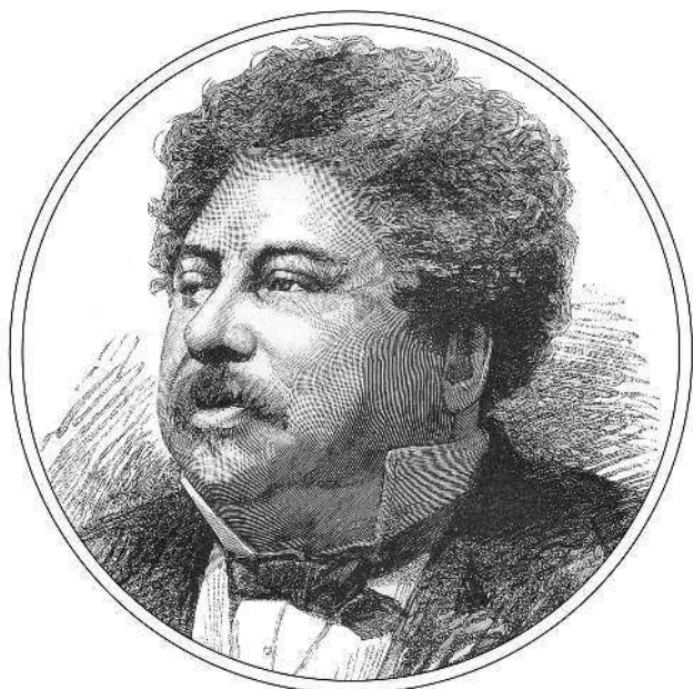
Александр ДЮМА (1802-1870)