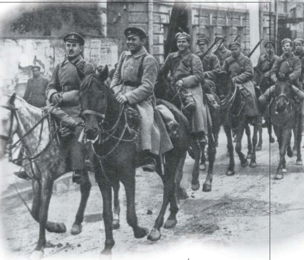
Федеральное государственное архивное учреждение «Общественный архив России»

ве- со- бий ась Ве- гро- чем ово- сти- Со- чес- акла ида Гер- ные ш- им- ной г. — иял