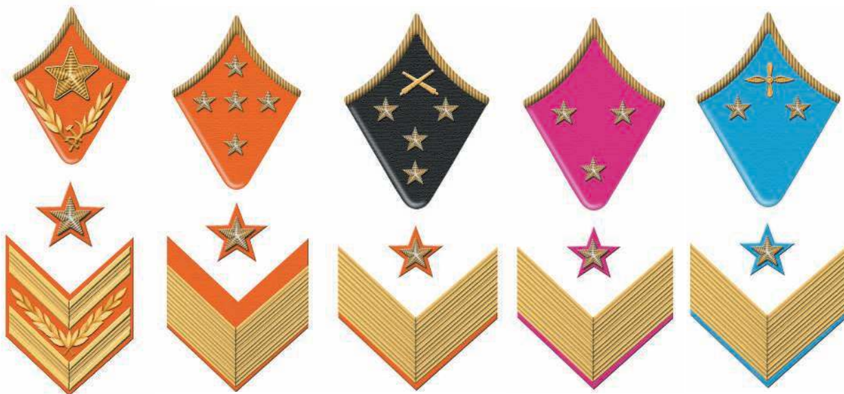
Таблица 5. Знаки различия для разных категорий командного состава РККА к началу Великой Отечественной войны