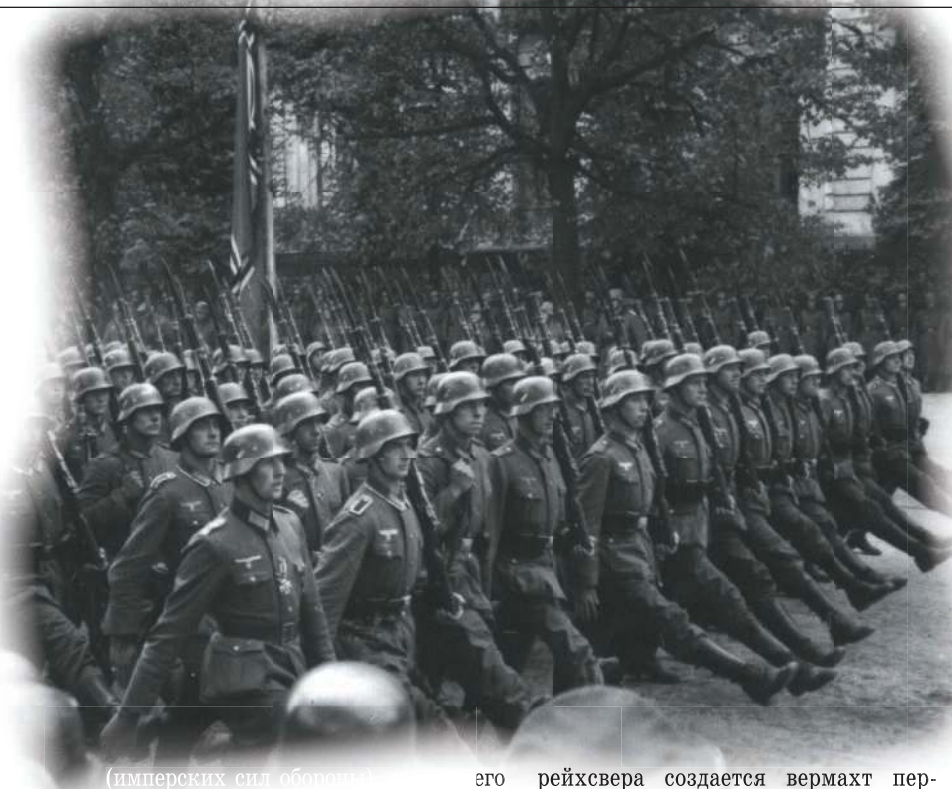
(имперских сил обороны)

против Польши 56 дивизий и 4 бригады (всего до 1 600 000 человек). К июню же 1941 г., т. е. к началу Великой Отечественной войны, на западных границах СССР была сосредоточена вражеская группировка из 12 армий (8 немецких, 2 румынских, 2 финских) и 4 германских танковых групп — всего 190 дивизий до 5,5 млн человек, из них 4,6 млн в составе немецких частей.