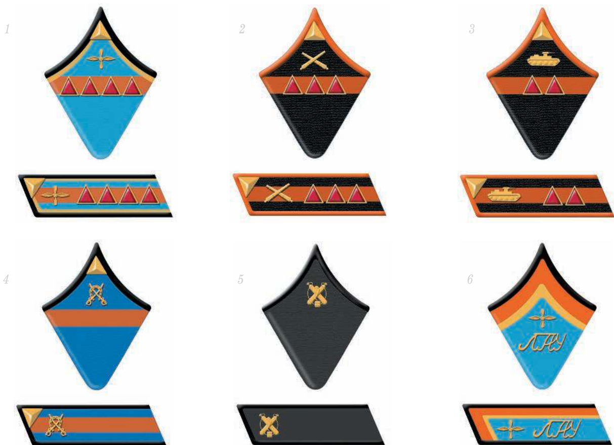
▲ Знаки различия младшего начальствующего, рядового состава и курсантов (1940 г.): 1 — старшина (авиация); 2 — старший сержант (артиллерия); 3 — сержант (бронетанковые войска); 4 — ефрейтор (кавалерия); 5 — рядовой (химические войска); 6 — курсант (авиация).