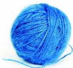
Пряжа из смеси акрила и шерсти