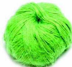
Пряжа из смеси акрила и мохера