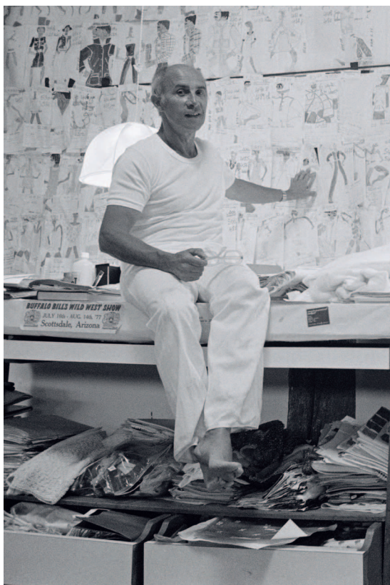
Андре Курреж в своей мастерской на ферме в Стране Басков в 1978 году.

Страница 14. Простое черное бикини от Андре Куррежа для Роми Шнайдер в фильме «Бассейн». Лаконичный дизайн характерен для минималистского подхода Куррежа к моде.