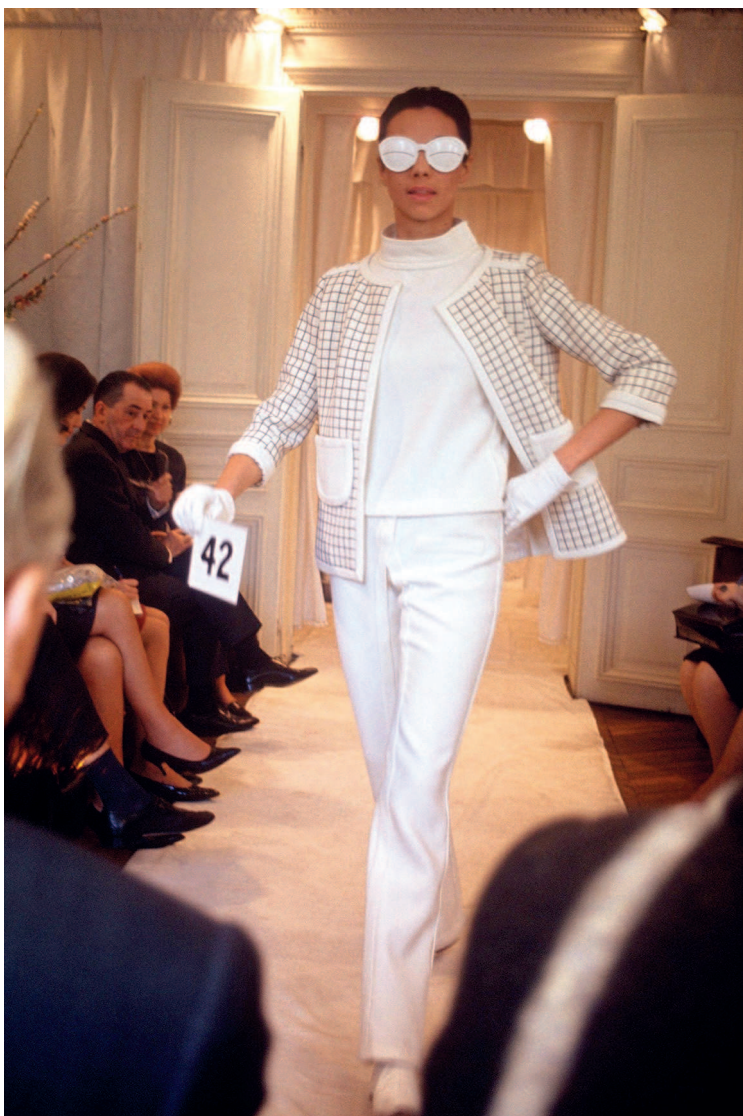
Знаменитые «солнечные очки эскимоса» от Куррежа, прототипом для которых стали снежные очки инуитов, впервые были показаны в коллекции «Лунная девушка» в 1965 году.

вклад был небольшим, но как часть дизайнерской эстетики Хепберн, выдержал проверку временем. Хепберн сыграла Джоанну, которая в начале картины предстает как простая наивная девушка и заканчивает ее как замужняя женщина на грани развода, облаченная с головы до ног в последние творения космической моды. Фильм «Двое на дороге» стал одним из самых культурно значимых проектов актрисы, так как он показал seismicкое изменение на рынке моды, которое актуально и сейчас. Юность одержала окончательную победу. Начиная с шестидесятых годов одежда предназначается для подростков, а взрослым женщинам, подобным Хепберн, бывшим когда-то завзятыми модницами, остается только играть в догонялки. Курреж предоставил для съемок картины «Двое на дороге» очки от солнца в своем фирменном «эскимосском» стиле — с прорезями для глаз, представленные в 1965 году. Но очки Хепберн в фильме все-таки более практичны.