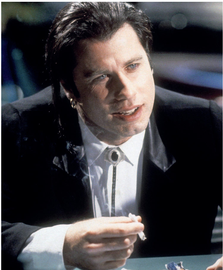
Костюмер Бетси Хайман добавила кожаные лацканы к черному костюму от Аньес Б., который Джон Траволта носил в «Криминальном чтиве», чтобы придать ансамблю нотку стиля рокабилли.