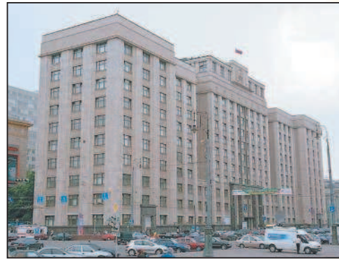
Здание Государственной Думы РФ