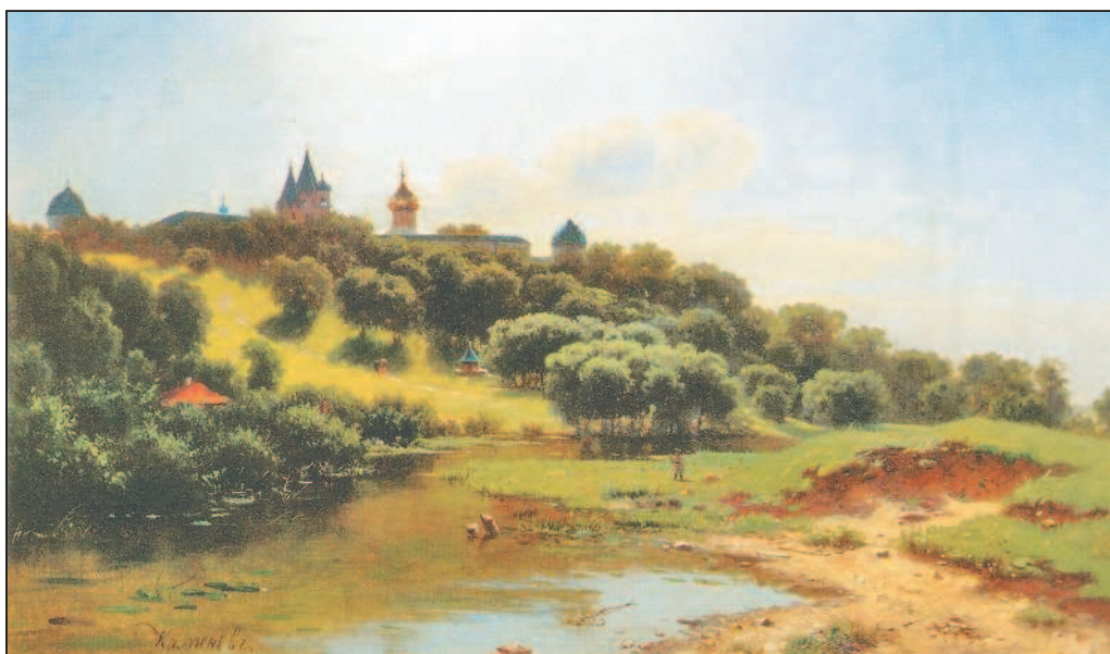
Л. Каменев. Вид на Саввино-Сторожевский монастырь