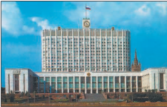
Здание Правительства России