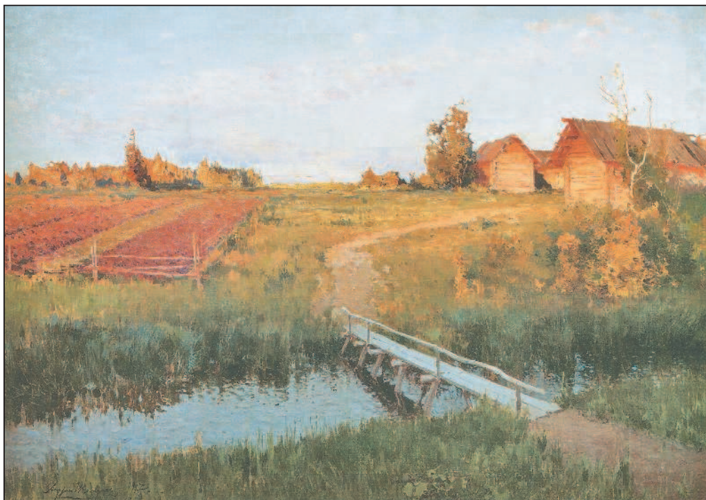
А. Шильдер. Село. Закат