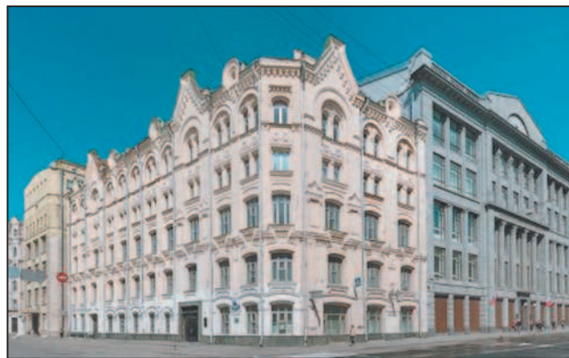
Здание Верховного суда РФ

Ключевые слова: Российская Федерация, страна, государство, органы власти, символы государства.