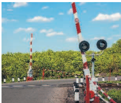
Железнодорожный переезд, оборудованный шлагбаумом

«Железнодорожный переезд» — пересечение дороги с железнодорожными путями на одном уровне.