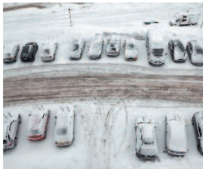
Типичная парковка на придомовой территории в городе

«Парковка (парковочное место)» — специально обозначенное и при необходимости обустроенное и оборудованное место, являющееся в том числе частью автомобильной дороги и (или) примыкающее к проезжей части и (или) тротуару, обочине, эстакаде или мосту либо являющееся частью подэстакадных или подмостовых пространств, площадей и иных объектов улично-дорожной сети, зданий, строений или сооружений и предназначенное для организованной стоянки транспортных средств на платной основе или без взимания платы по решению собственника или иного владельца автомобильной дороги, собственника земельного участка