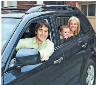
Водитель и пассажиры

«Пассажир» — лицо, кроме водителя, находящееся в транспортном средстве (на нем), а также лицо, которое входит в транспортное средство (садится на него) или выходит из транспортного средства (сходит с него).