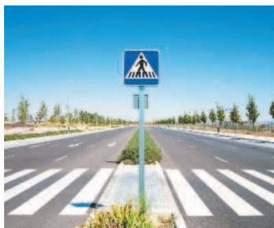
Конструктивно выделенный бордюром камнем островок безопасности

«Островок безопасности» — элемент обустройства дороги, разделяющий полосы движения (в том числе полосы для велосипедистов), а также полосы движения и трамвайные пути, конструктивно выделенный бордюром камнем над проезжей частью дороги или обозначенный техническими средствами организации дорожного движения и предназначенный для остановки пешеходов при переходе проезжей части дороги. К островку безопасности может относиться часть разделительной полосы, через которую проложен пешеходный переход.