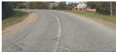
Участок дороги с ограниченной видимостью

«Ограниченная видимость» — видимость водителем дороги в направлении движения, ограниченная рельефом местности, геометрическими параметрами дороги, растительностью, строениями, сооружениями или иными объектами, в том числе транспортными средствами.