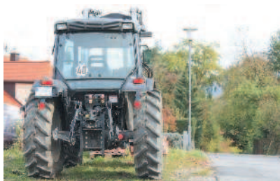
Трактор — механическое транспортное средство

«Механическое транспортное средство» — транспортное средство, приводимое в движение двигателем. Термин распространяется также на любые тракторы и самоходные машины.