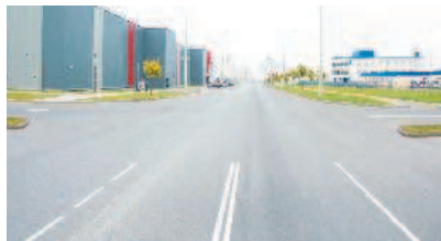
Четырехсторонний перекресток двух дорог, одна из которых имеет разделительную полосу

«Перекресток» — место пересечения, примыкания или разветвления дорог на одном уровне, ограниченное воображаемыми линиями, соединяющими соответственно противоположные, наиболее удаленные от центра перекрестка начала закруглений проезжих частей. Не считаются перекрестками выезды с прилегающих территорий.