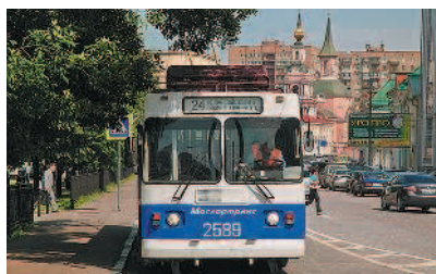
Автобус, троллейбус, трамвай — маршрутные транспортные средства

«Механическое транспортное средство» — транспортное средство, приводимое в движение двигателем. Термин распространяется также на любые тракторы и самоходные машины.