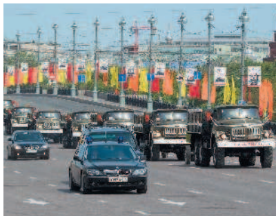
Организованная транспортная колонна

«Организованная транспортная колонна» — группа из трех и более механических транспортных средств, следующих непосредственно друг за другом по одной и той же полосе движения с постоянно включенными фарами в сопровождении головного транспортного средства с нанесенными на наружные поверхности специальными цветографическими схемами и включенными проблесковыми маячками синего и красного цветов.