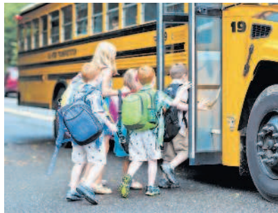
Организованная перевозка группы детей в специальном автобусе

«Организованная перевозка группы детей» — перевозка в автобусе, не относящемся к маршрутному транспортному средству, группы детей численностью восемь и более человек, осуществляемая без их родителей или иных законных представителей.