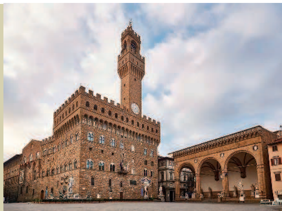
Арнольфо ди Камбио

Полностью отойдя от условной византизирующей живописной манеры в духе Чимабуэ и других мастеров, Каваллини придал своим религиозным образам более земной, осязательный характер и применил в своих композициях невиданную до того в итальянской живописи светотеневую моделировку, которая позволила преодолеть плоскостной характер живописи.