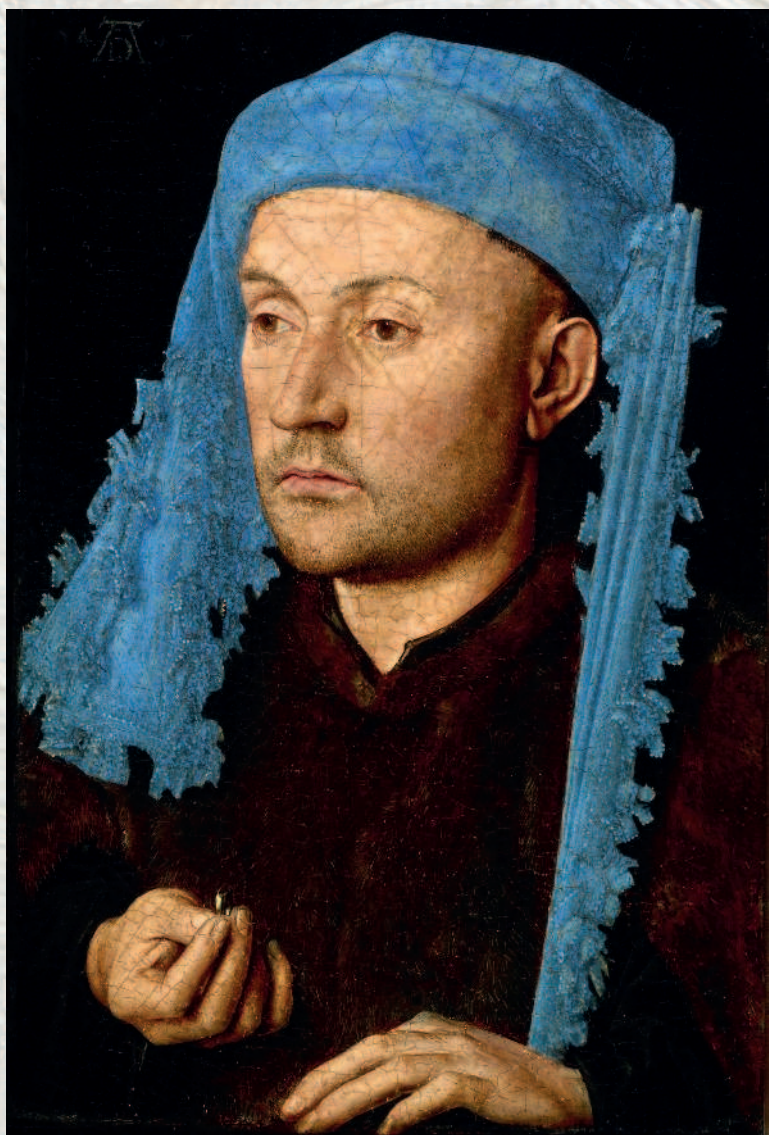
Ян Ван Эйк. Портрет мужчины в голубом шапероне. Ок. 1430. Национальный музей Брукентала, Сибиу