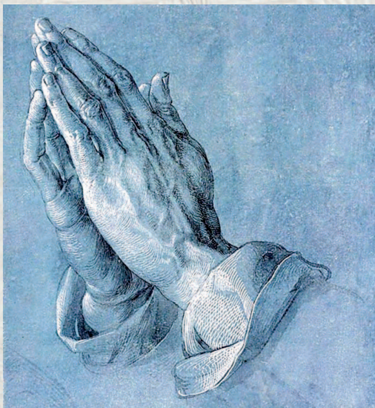
Альбрехт Дюрер. Руки молящегося. Ок. 1508

“ Когда понятием «Возрождение» охватывают все западно-европейские страны, может возникнуть впечатление, будто речь идет о чем-то, по сути, для всех них едином. В действительности же общим было только стремление во что бы то ни стало обособиться друг от друга.