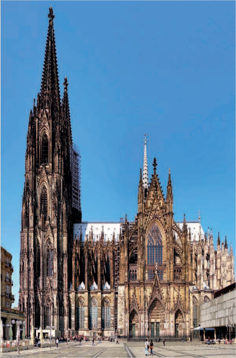
Готический собор в Кёльне