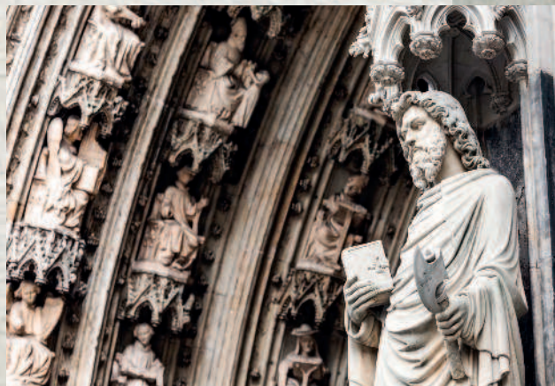
Готический собор в Кёльне. Детали фасада

Обычно термин «готика» используют применительно к архитектурным сооружениям, однако этот художественный стиль господствовал и в других направлениях искусства. Красочные витражи, книжная миниатюра, которая расцвела с возникновением светской литературы и распространением иллюстрированных рукописей, развитие портретного жанра — все это относится к эпохе господства готики.