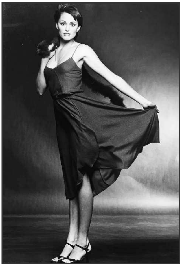
Первая профессиональная съемка в Голливуде, 1978 год