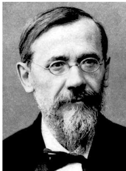
Василий Осипович Ключевский (1841–1911).