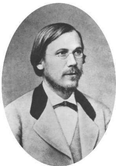
В.О. Ключевский в 1873 г.