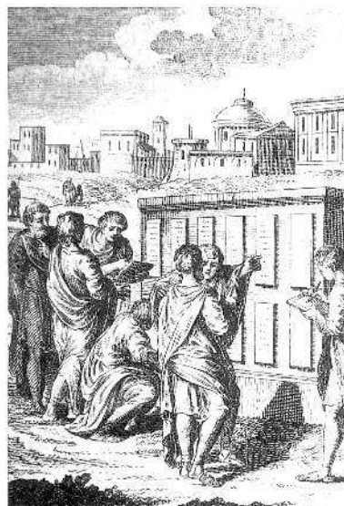
Законы двенадцати таблиц. Один из древнейших письменно зафиксированных сводов римского права.

ПРЕОБЛАДАНИЕ СОЦИОЛОГИЧЕСКОЙ ТОЧКИ ЗРЕНИЯ В МЕСТНОЙ ИСТОРИИ. Всеобщая история создавалась, по крайней мере доселе, не совокупной жизнью всего человечества, существовавшего в известное время, и не однообразным взаимодействием всех сил и условий человеческой жизни, а отдельными народами или группами немногих народов, которые преемственно сменялись при разнообразном местном и временном подборе сил и условий, нигде более не повторявшемся. Эта непрерывная смена народов на исторической сцене, этот вечно изменяющийся подбор исторических