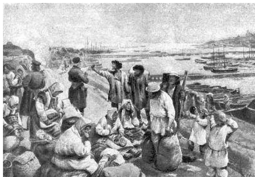
«Прибытие на Нижегородскую ярмарку партии крепостных на продажу».