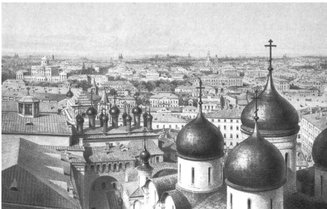
Вид Москвы в 1-й половине XIX в.

Литография из альбома «Панорама Москвы и ее окрестностей» (М., Париж, 1847)