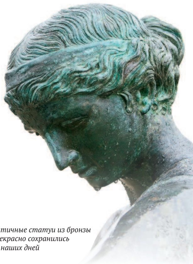
Античные статуи из бронзы прекрасно сохранились до наших дней

в истории металлургии. Имеются убедительные доказательства того, что уже в V тыс. до н. э. залежи меди разрабатывались в Югославии (рудник Рудна Глава) и Болгарии (рудник Айбунар) и других месторождениях.