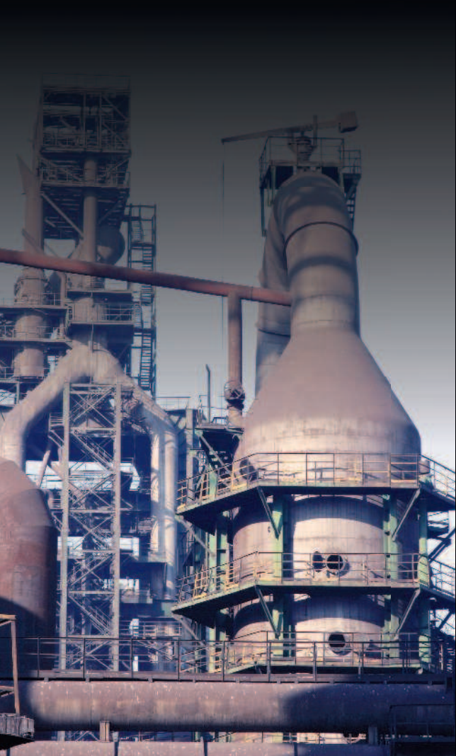
Современные доменные печи значительно выросли в размерах

глийский промышленник-металлург Абрахам Дерби I предложил использовать кокс, полученный из каменного угля. До этого каменный уголь в металлургии не использовался из-за относительно высокого содержания вредных для металла примесей, прежде всего серы. К тому же уголь в процессе нагрева измельчался, его взвесь затрудняла подачу воздуха. Напротив, нагретый до высоких температур (950–1050 °С) без доступа воздуха древесный уголь лишился многих примесей и коксовался — приобретал более плотную структуру. Помимо этого, Абрахам Дерби I запатентовал способ отливки чугуна в песочных формах, что значительно удешевило производство металла.