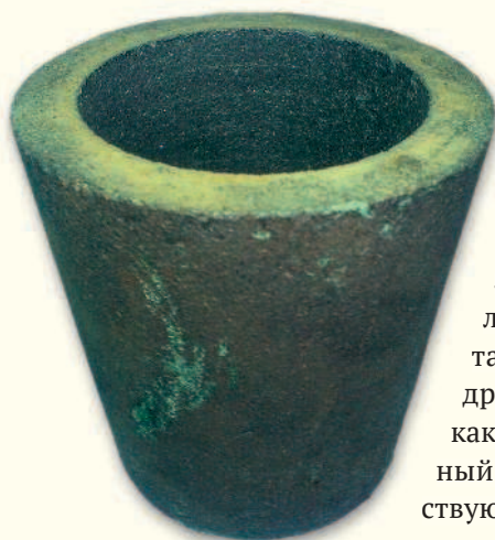
Тигель из графита для плавки металла

выплавленной по определенной технологии, которая и обуславливает характерные для булата высокие качества.