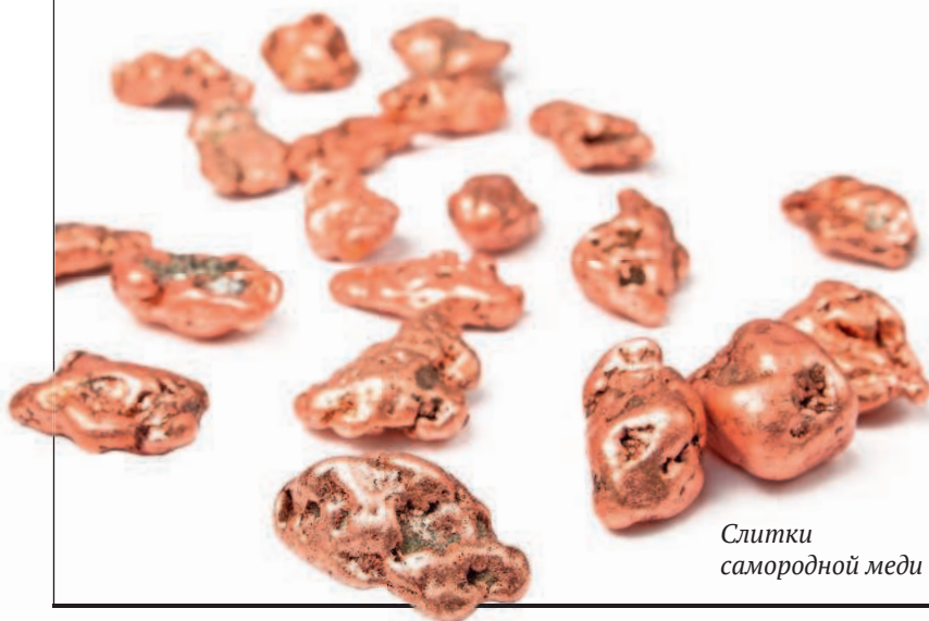
Слитки самородной меди