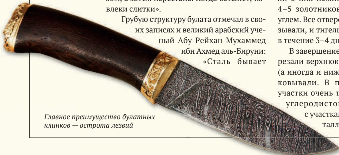
Главное преимущество булатных клинков — острота лезвий

В завершение производства у слитка отрезали верхнюю часть пористого металла (а иногда и нижнюю часть, и бока) и расковывали. В получившейся заготовке участки очень твердой, хрупкой высокоуглеродистой стали чередовались с участками вязкого, но мягкого металла.