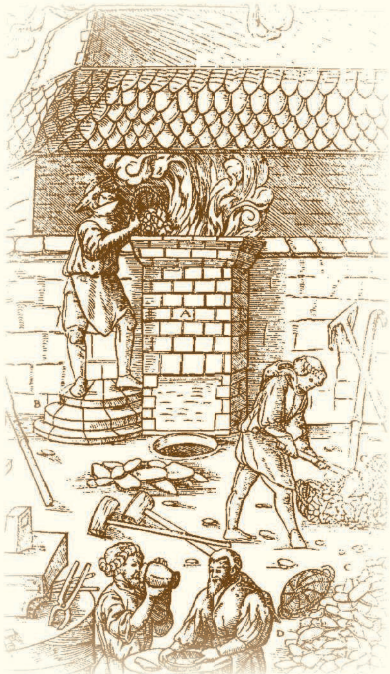
Закрытая шахта штукофена хорошо концентрировала тепло

Вслед за штукофенами в XV в. в Европе появились усовершенствованные печи нового типа — блауофены , которые были больше и выше. Но главное, чем отличался блауофен от штукофена, — то, что воздух в него подавался уже подогретым. Это позволило увеличить температуру плавления и значительно повысить выход железа из руды. Однако такой тип печи несколько опередил свое время. Дело в том, что вместе с повышением температуры большее количество железа насыщалось углеродом до состояния чугуна, который, смешанный со шлаками, по-прежнему не поддавался очистке. Если в штукофенах количество получаемого чугуна не превышало 10 %, то в блауофенах оно доходило до 30 %. Во всем мире чугун получил далеко не лестные названия. В Англии его прозвали «свинным», ни на что не годным железом. Это название сохранилось до наших дней. В Центральной