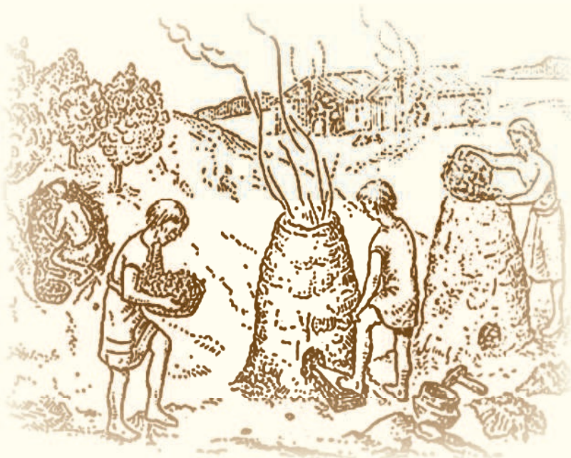
Сыродутная печь представляла собой полое сооружение из камней, обмазанных глиной, или целиком из глины. В стенах были предусмотрены отверстия для раздувания мехами

Гомер в своих поэмах «Илиада» и «Одиссея» называл железо «многотрудным метал-