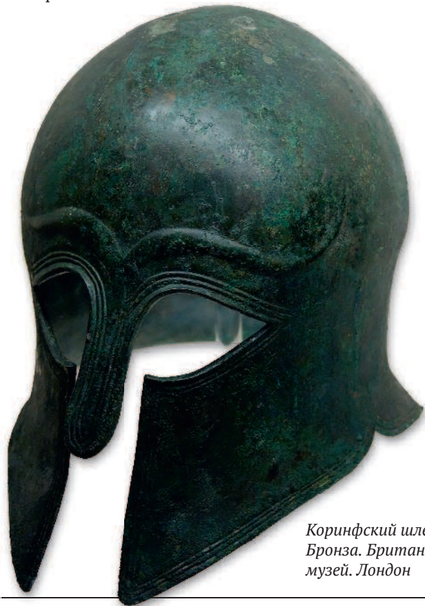
Коринфский шлем. Бронза. Британский музей. Лондон

«Железная революция» ознаменовала начало I тыс. до н. э. После падения государства хеттов, больших мастеров в обработке железа, греческие торговцы распространили их секреты. С этого момента железными изделиями стали вытесняться медные и бронзовые.