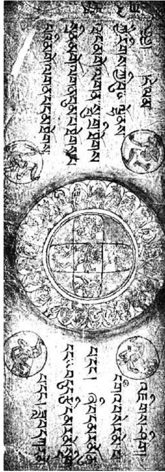
Слева: Бардо Тхёдол. Лист рукописи №35а Справа: Бардо Тхёдол. Лист рукописи №67а