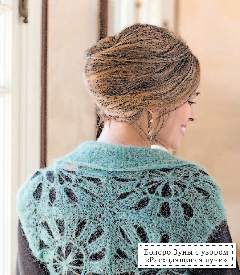
Болеро Зуны с узором «Расходящиеся лучи»