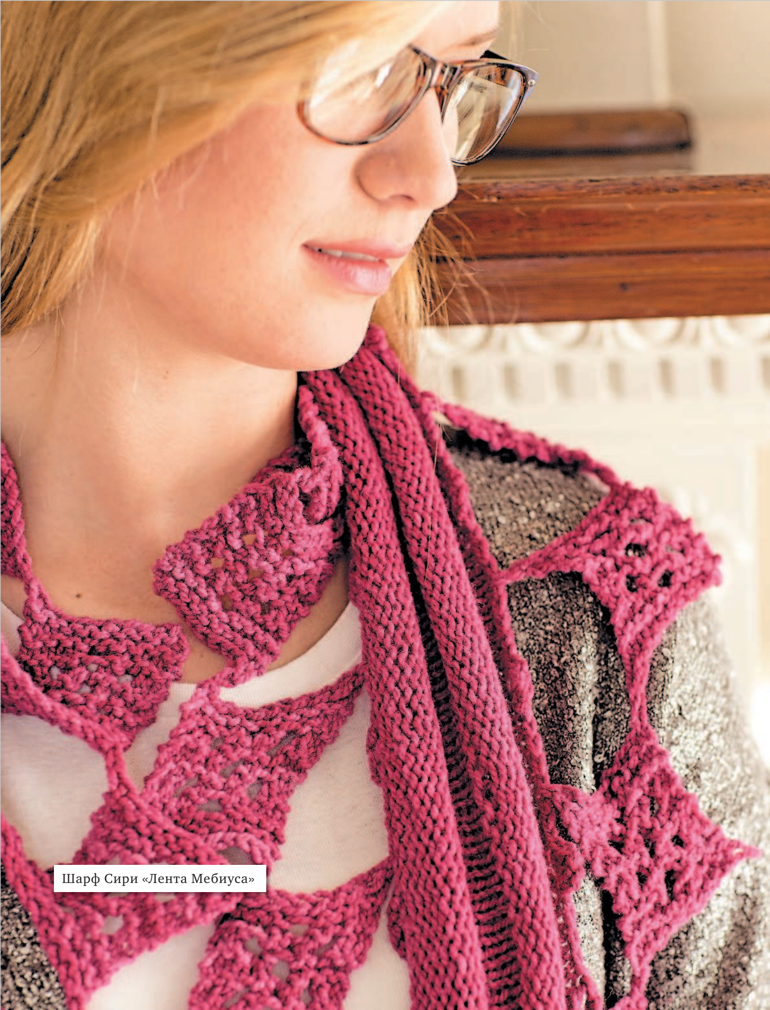
Шарф Сири «Лента Мебиуса»