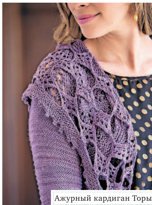
Ажурный кардиган Торы