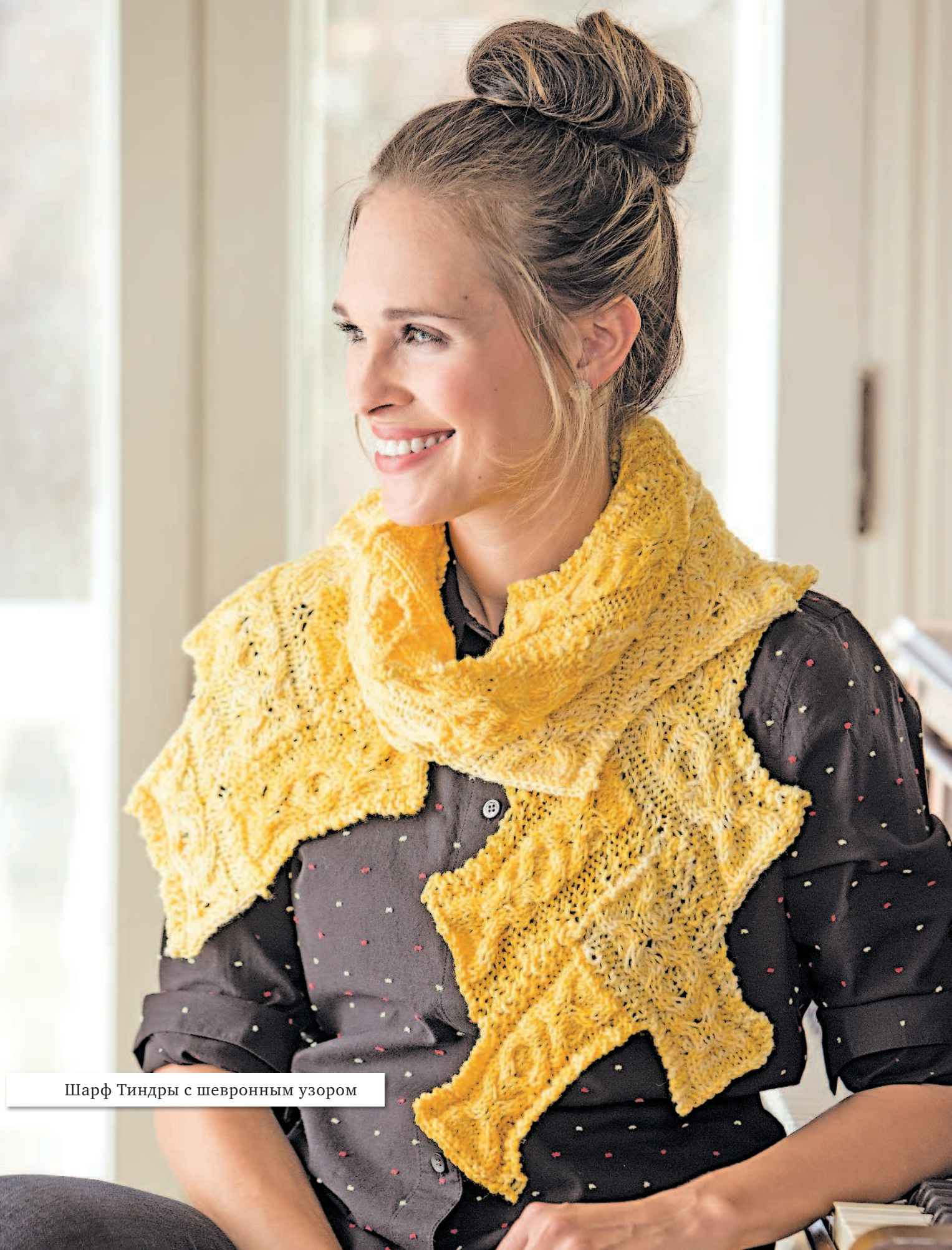
Шарф Тиндры с шевронным узором