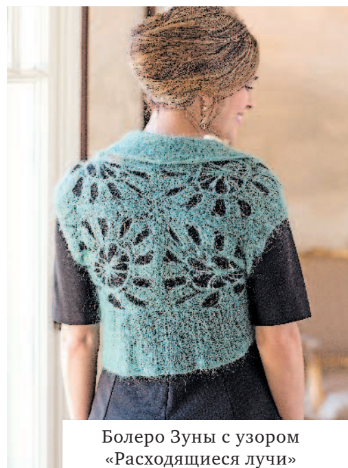
Болеро Зуны с узором «Расходящиеся лучи»