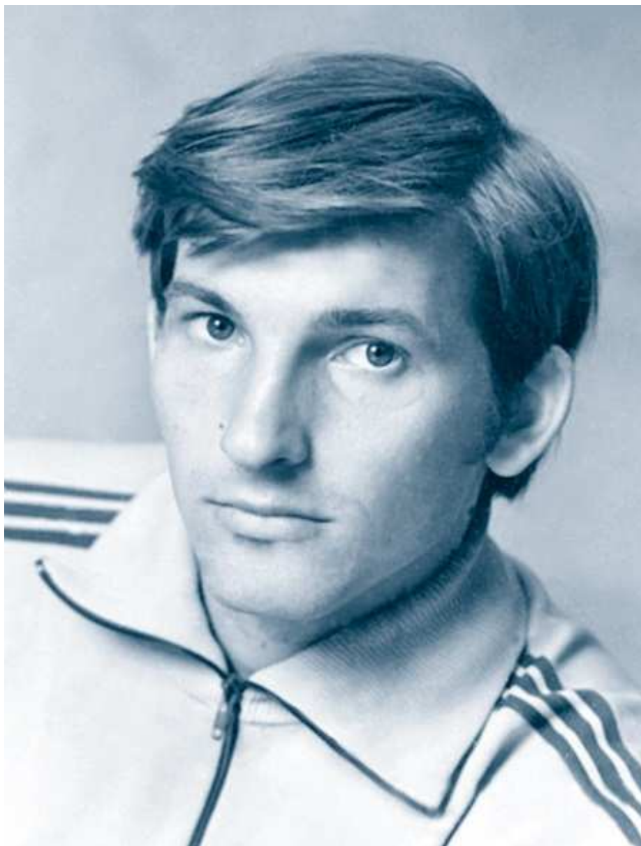
Владислав Третьяк пришел в хоккей в начале 1960-х гг.

1954 года, шли только радиотрансляции), из-за чего хоккей мгновенно становится самым популярным видом спорта в стране (вместе с фигурным катанием, слава которого началась у нас почти одновременно с хоккейной: на мировых турнирах стала доминировать советская пара Людмила Белоусова и Олег Протопопов).