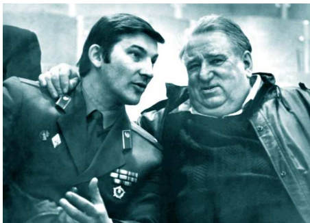
Анатолий Тарасов и Владислав Третьяк

Так Третьяк стал тренироваться с взрослыми мастерами, причем так старался, что даже сам удивлялся своей прыти: бросался за каждой, даже самой безнадежной шайбой. Его кумиром в ту пору был нападающий армейцев Евгений Мишаков, поэтому он стал так же, как и он... косолапить. Так длилось до июля.